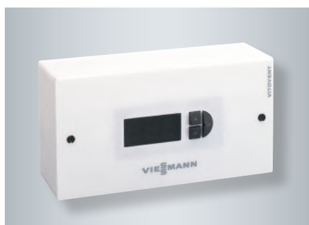
Trinkontakt til enkel betjening